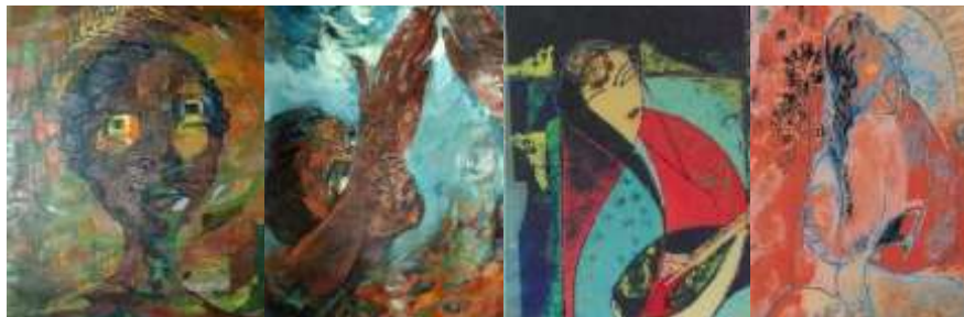
شکل ۱۲. مهین عظیما شکل ۱۳. مهین عظیما شکل ۱۴. منصوره حسینی شکل ۱۵. منصوره حسینی