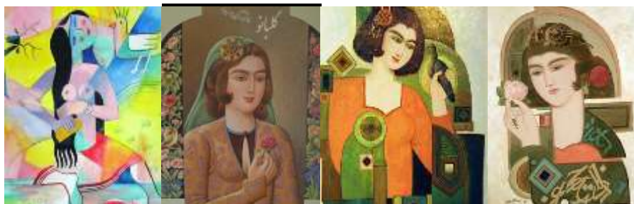
شکل ۱. علی اکبر معصومی شکل ۲. علی اکبر معصومی شکل ۳. علی اکبر معصومی شکل ۴. پرویز کلانتری

نقاشان زن از مهین عظیما (۱۳۰۸-)، لیلی متین دفتری (۱۳۱۵-۱۳۸۸)، معصومه حسینی (۱۳۰۵-۱۳۹۱) و شکوه ریاضی (۱۳۰۰-۱۳۴۱) نام برد.